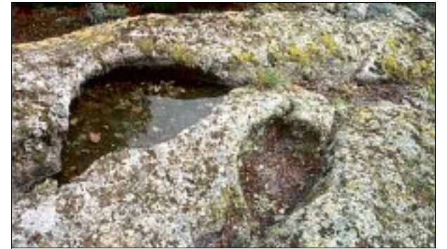
Les pierres à bassin forment des petites, ou plus grosses cuvettes, certainement dues à l'érosion.