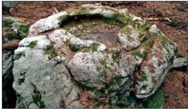
À Montguerlhe, la pierre à bassin a été directement creusée par l'homme.