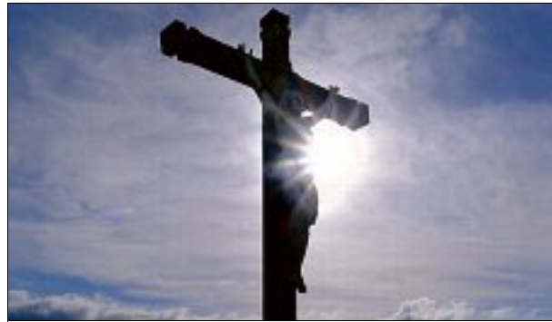
Lors de la christianisation, les pierres à bassin ont été utilisées comme lieu de culte et adulées.