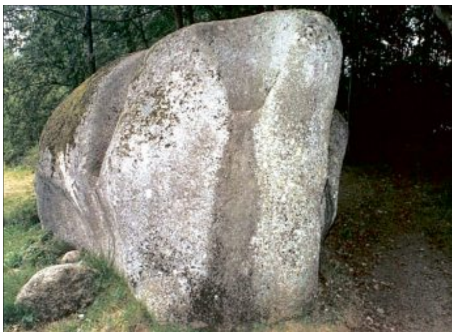
À Lachaux, la pierre du Sang est ainsi nommée car, selon les croyances, elle aurait été utilisée dans les rituels de sacrifices gaulois.