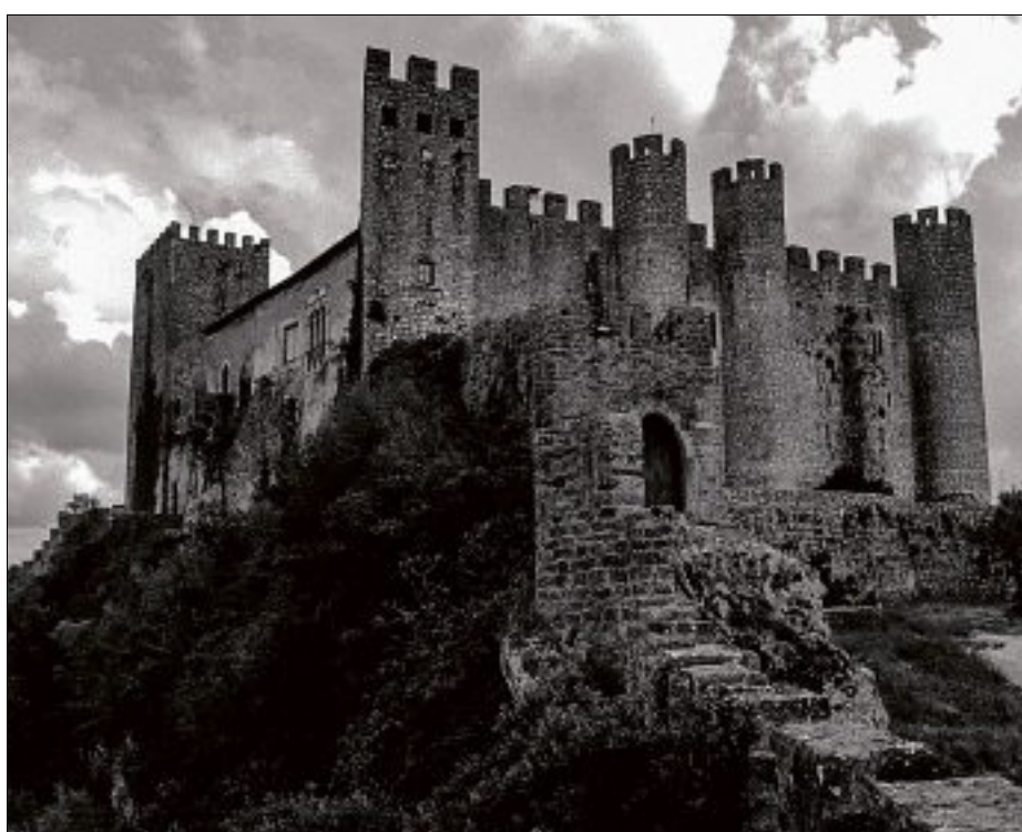
Aux Millières, un château aurait abrité un méchant seigneur, qui aurait enlevé et tué une jeune fille. (PHOTO D'ILLUSTRATION)

Celle d'un méchant seigneur, nommé Griffard, vivant dans le donjon du château, qui aurait enlevé puis tué une jeune bergère, ainsi que son enfant. « Une histoire horrible », sourit Laurent Mosnier, spécialiste des Millières. La chanson évoque en effet « un paladin », qui « perçut une enfant de