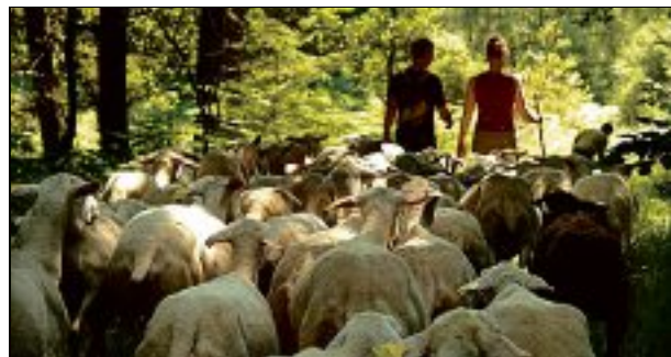
Le seigneur Griffard aurait enlevé une jeune bergère de 16 ans.