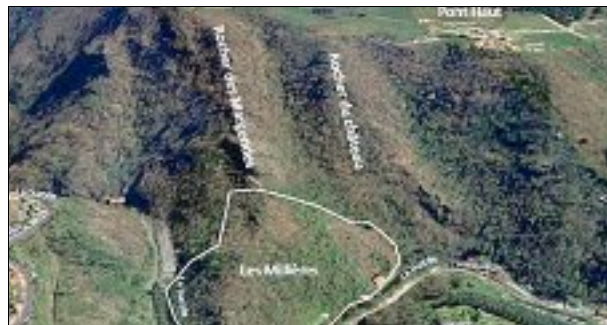
Le château aurait été situé au-dessus du hameau des Millières, près du rocher des Margerides.