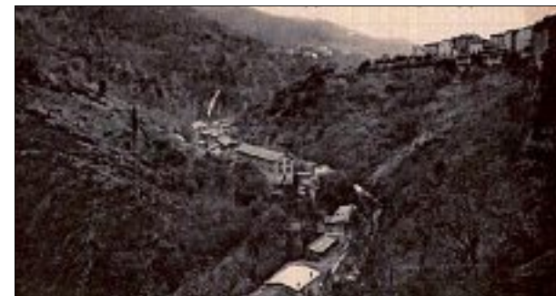
Le hameau des Millières surplombe la vallée des usines de Thiers.